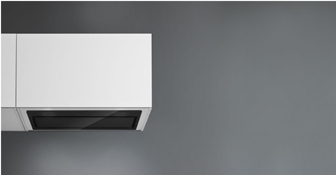
Снимката е само за информация Може да не отговаря на избрания модел

Touch screen контрол + функция 24ч Метален филтър за мазнини, отстраняем и почистващ се Включващ филтър с активен въглен Включващ дистанционно за управление Периметрална абсорбация с панел от калено стъкло Динамично LED осветление ( 2700K-5600K )